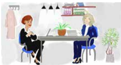
ILLUSTRATION: TOVE SIRI

I OKTOBER 2020 hade medlemmar som haft lönesamtal med sin arbetsgivare i årets lönerrevision 1 600 kr högre månadslön än de som inte haft något lönesamtal. Det blir nästan 20 000 kr mer varje år! Våra löneavtal ger dessutom förutsättningar för att skillnaden kan öka ännu mer om du förbereder dig väl inför samtalet. Kolla våra tips på nästa uppslag.